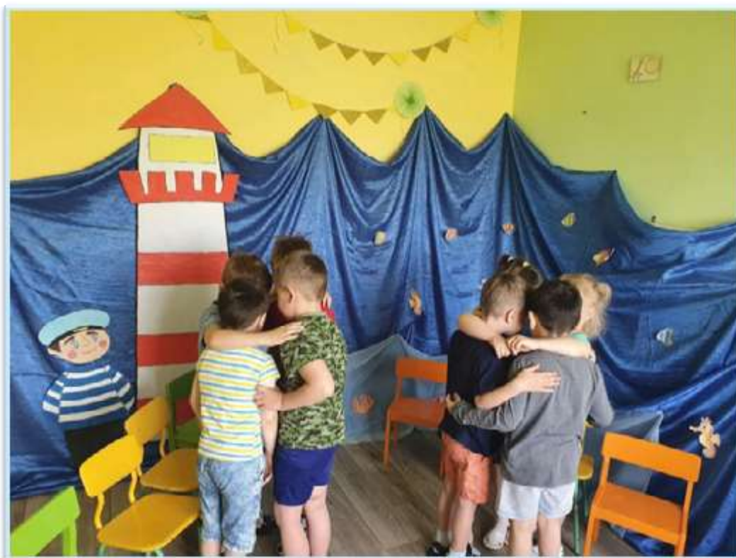
Рисунок 13. Квест - игра "Морское путешествие"