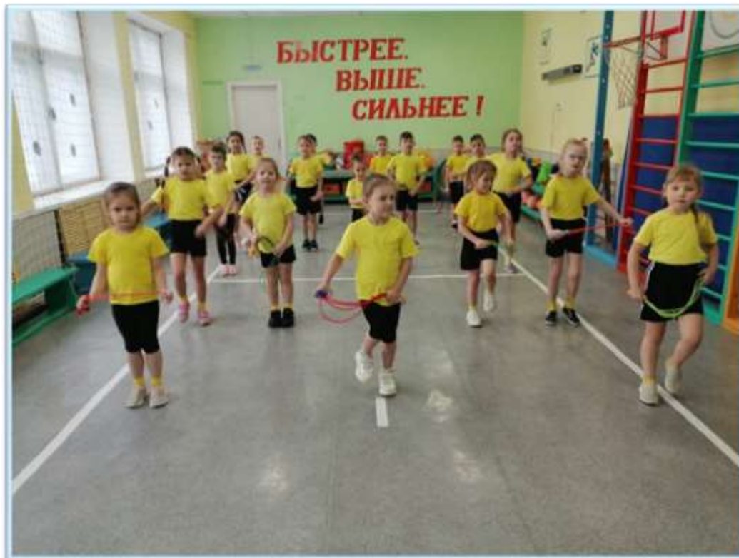
Рисунок 8. Соревнования по скиппингу "Весёлая скакалка"