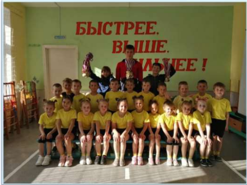
Рисунок 11. Урок ГТО в детском саду