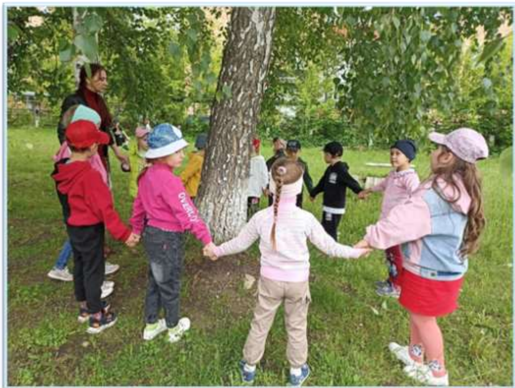
Рисунок 12. Хороводная игра "Во поле береза стояла"