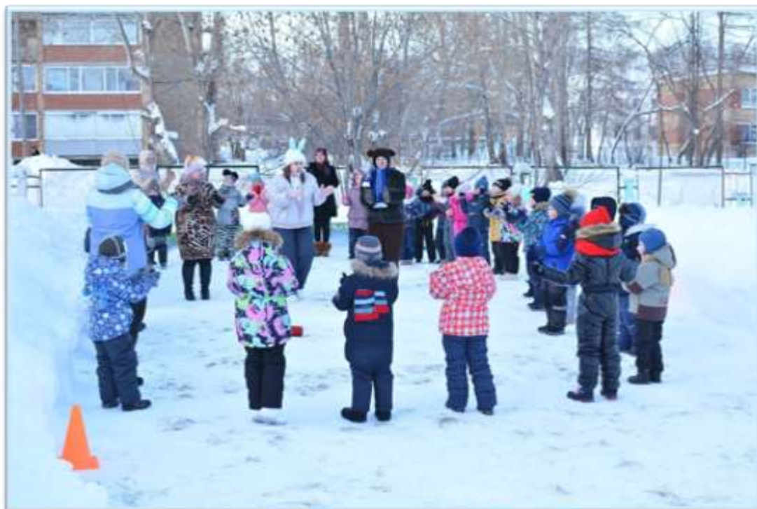
Рисунок 6. Зимний праздник "Олимпийские игры"