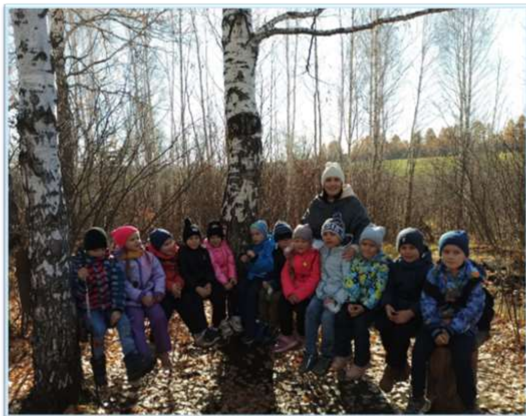
Рисунок 9. Традиционный осенний поход в лес