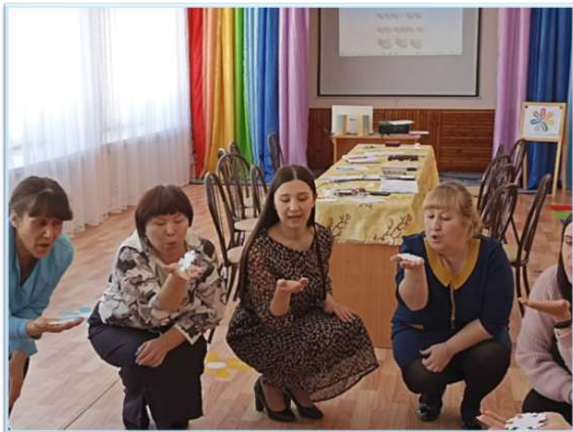
Рисунок 2. Семинар-практикум в форме деловой игры "Логопедическое ассорти"