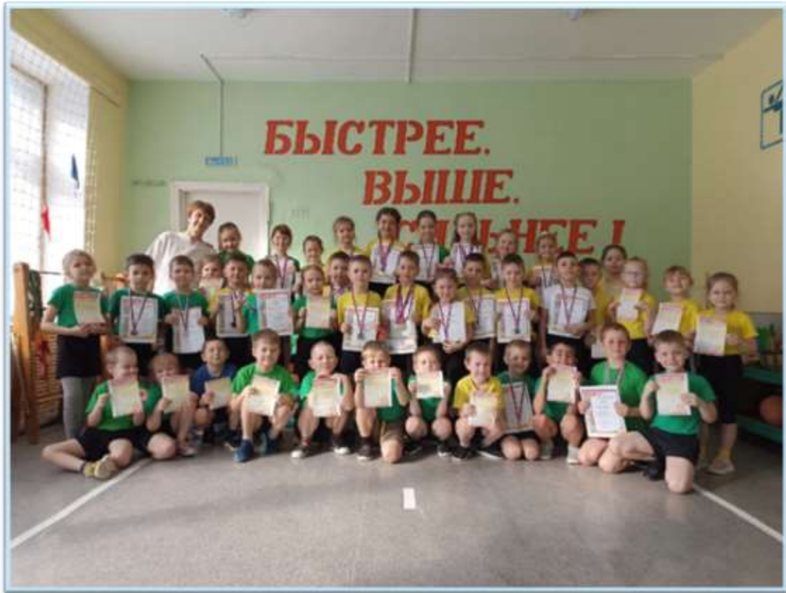
Рисунок 1. Закрытие Спартакиады 2022 на уровне ДОУ