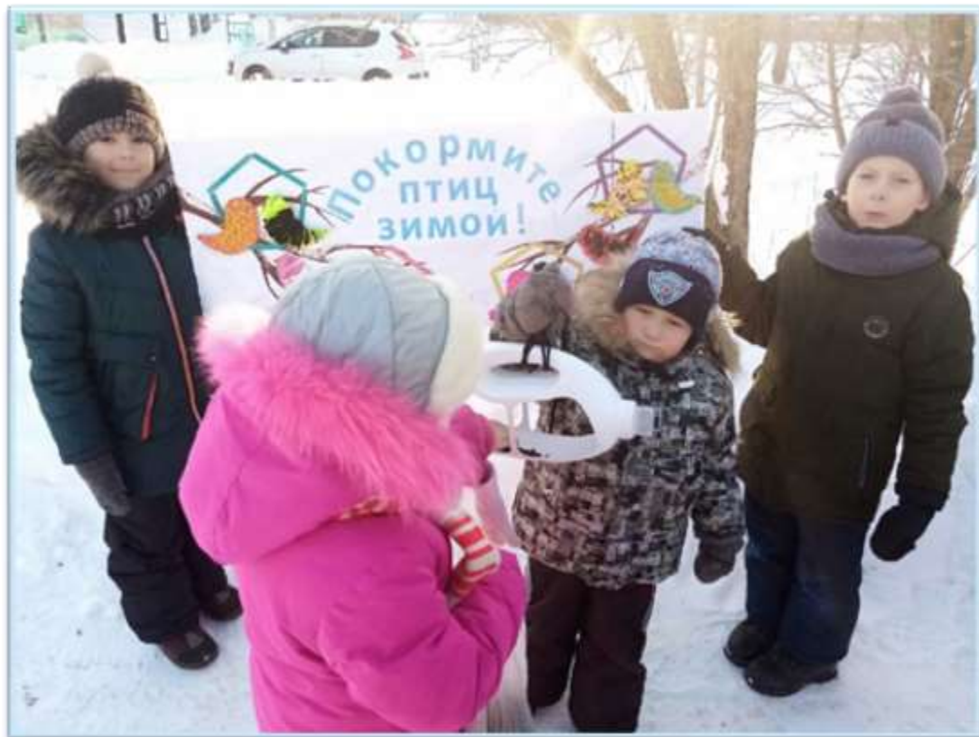
Рисунок 5. Акция "Покормите птиц зимой"