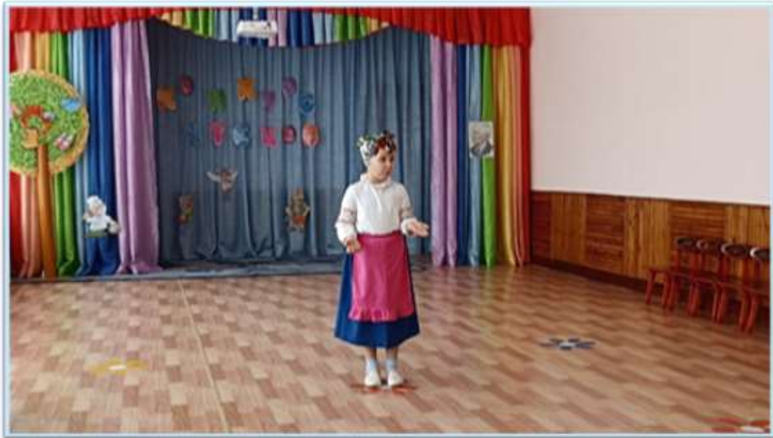
Рисунок 4. Конкурс чтецов "Добрый дедушка Корней" на уровне ДОУ, посвященный 140-летию со дня рождения детского писателя Корнея Ивановича Чуковского.