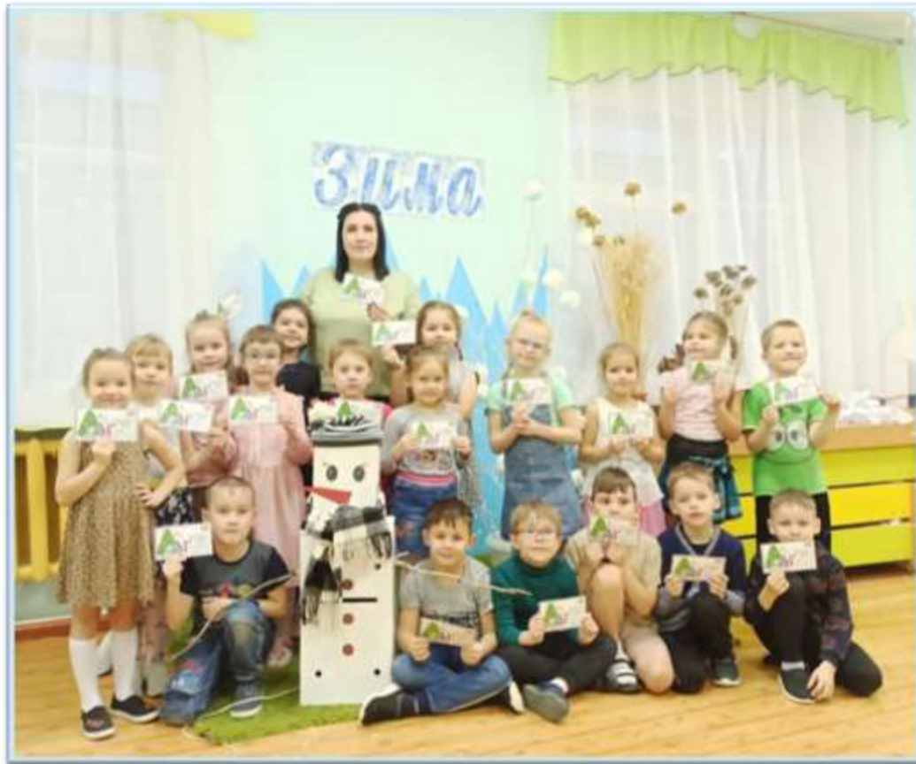
Рисунок 7. Акция "Письмо Деду Морозу"