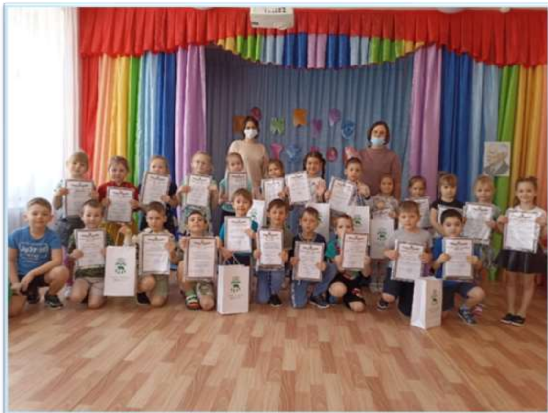
Рисунок 3. Подведение итогов конкурса "За что я люблю свой город" в рамках проекта по благоустройству улицы Горького