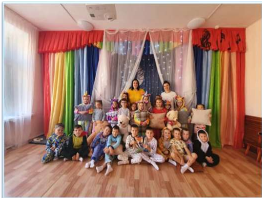
Рисунок 10. День чтения – 2021